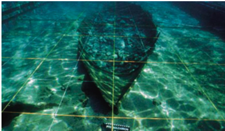
Pecio Fenicio Mazarrón II.

“Se levanta en un cerro amesetado de forma alargada, sobre la Rambla de Susana o de las Moreras, y queda bordeado por una curva de la carretera de Bolnuevo a Mazarrón. Dicha carretera seccionó una parte del cerro por su lado SE, donde en la primera visita que se realizó en 1978, todavía se advertían en superficie unas estructuras circulares en piedra que se interpretaron como sepulturas megalíticas de tipo tholos con túmulo circular. Estas sepulturas han sido destruidas con motivo de la puesta en explotación de una cantera que suministró material de construcción para el puerto deportivo de Mazarrón”. (Región de Murcia Digital, Patrimonio)