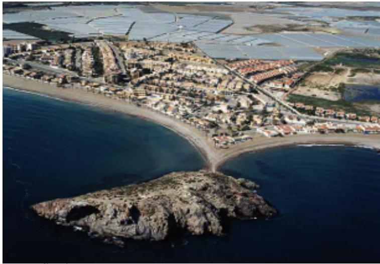
Fotografía aérea: Paraje actual denominado Susaña

Imagen actual con los invernaderos de Susaña al fondo y el promontorio del Castellar. En una visita con el profesor de Historia Fernando Guil al Castellar, me mostró las marcas de cuerdas en la roca, debidas al continuo amarre de barcos en épocas pasadas. En su libro, Guillén Riquelme nos comenta que cuando González Simancas visita Mazarrón entre 1905 y 1907, informa de un descubrimiento importante: Un número considerable de restos humanos acaban de ser hallados cerca de la orilla, un kilómetro al oeste de la barriada del Puerto. Las sepulturas habían sido expoliadas por los obreros que las encontraron a 1200 metros del Cabezo del Castellar -perteneciente a la hacienda de Susaña-, lugar donde González Simancas atestiguó haber visto cimentaciones de arruinados edificios y cerámica tan abundante como para certificar un asentamiento prerromano. No dudó en establecer definitivamente Ficara en Susaña a pesar de que, ya entonces, se trataba de un paisaje bastante alterado por el progreso de la actividad minera que aquellos años disfrutaba Mazarrón.