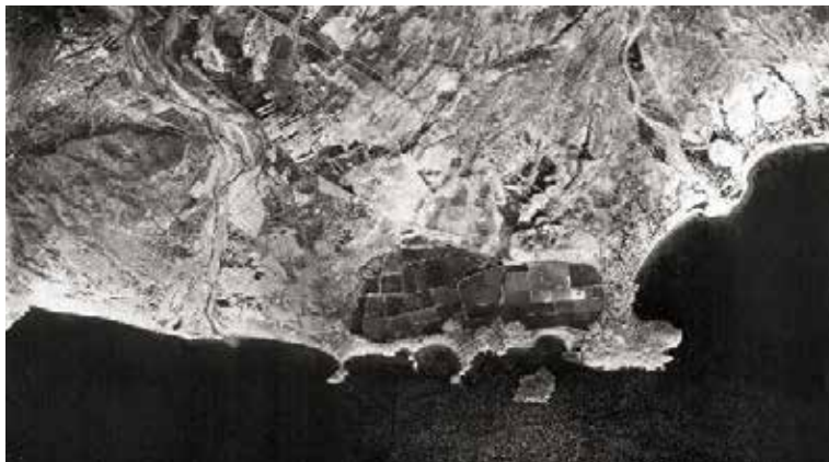
Puerto de Mazarrón, vuelo americano 1956. Atlas Región de Murcia

Imagen actual con los invernaderos de Susaña al fondo y el promontorio del Castellar. En una visita con el profesor de Historia Fernando Guil al Castellar, me mostró las marcas de cuerdas en la roca, debidas al continuo amarre de barcos en épocas pasadas. En su libro, Guillén Riquelme nos comenta que cuando González Simancas visita Mazarrón entre 1905 y 1907, informa de un descubrimiento importante: Un número considerable de restos humanos acaban de ser hallados cerca de la orilla, un kilómetro al oeste de la barriada del Puerto. Las sepulturas habían sido expoliadas por los obreros que las encontraron a 1200 metros del Cabezo del Castellar -perteneciente a la hacienda de Susaña-, lugar donde González Simancas atestiguó haber visto cimentaciones de arruinados edificios y cerámica tan abundante como para certificar un asentamiento prerromano. No dudó en establecer definitivamente Ficara en Susaña a pesar de que, ya entonces, se trataba de un paisaje bastante alterado por el progreso de la actividad minera que aquellos años disfrutaba Mazarrón.