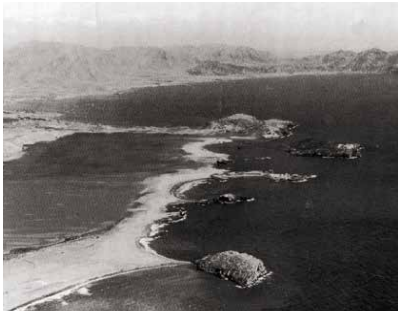
Visión idealizada de la antigua bahía de Mazarrón. Mariano C. Guillén Riquelme, "Las monedas de plomo de Susaña"