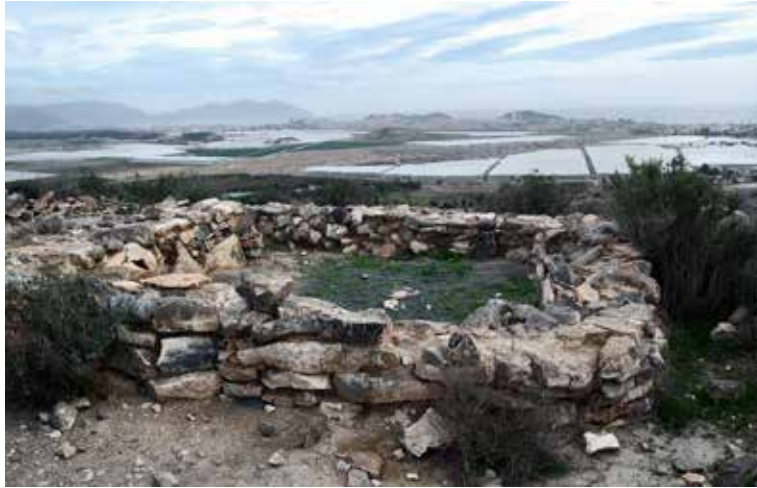
Cabezo del Plomo, Mazarrón.

La primera población fortificada del paraje de Susaña y de la Región de Murcia es el Cabezo del Plomo, que se eleva al otro lado de la rambla de Las Moreras. Este yacimiento de 5000 años de antigüedad es, en origen un asentamiento fortificado de época neolítica donde se han localizado sepulturas megalíticas y abundante cerámica a mano, así como fragmentos a torno de cerámica de tipo iberorromano.