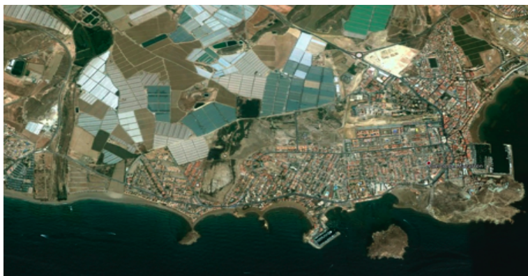
Fotografía aérea de Puerto de Mazarrón

Fotografía aérea de mediados del siglo XX, anterior al desarrollo urbanístico de la zona.